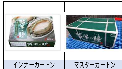
インナーカートン マスターカートン