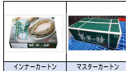
インナーカートン マスターカートン