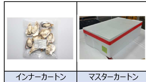
インナーカートン