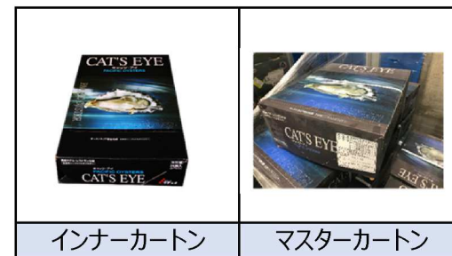
インナーカートン マスターカートン